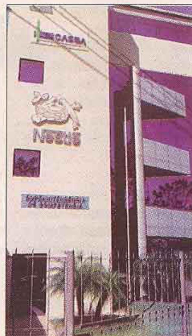
La SC realizará ponencias y capacitaciones.

El objeto principal de esta actividad es informarles sobre la manera de cómo la relación con las asociaciones puede ser elemento clave para el trabajo de la SC a través de la denuncia ciudadana.