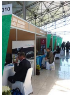
La última edición de MITM Américas.

MITM Américas es un foro interactivo de un día y medio de duración, donde se trabaja mediante citas individuales y pre-establecidas. Para poder seleccionar citas, los expositores reciben los perfiles detallados de los compradores días antes del comienzo de MITM, junto a un formulario de solicitud de citas. Los compradores también reciben los perfiles de los expositores para hacer su selección.